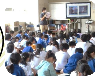
認知症サポーター養成講座