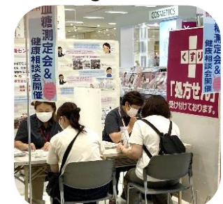
南イオン薬局との合同相談会