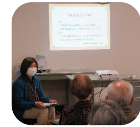
権利擁護に関する講話