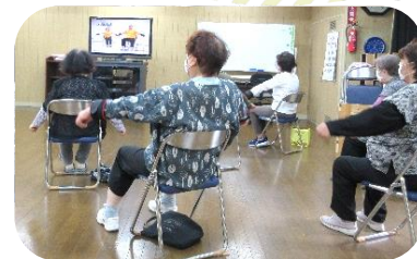
体力測定・いきいき百歳体操